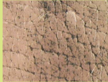
Peau attaquée par les polluants